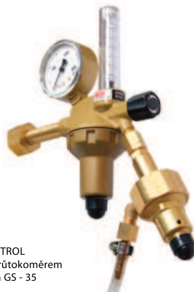
DINCONTROL s plovákovým průtokoměrem a spořičem GS - 35