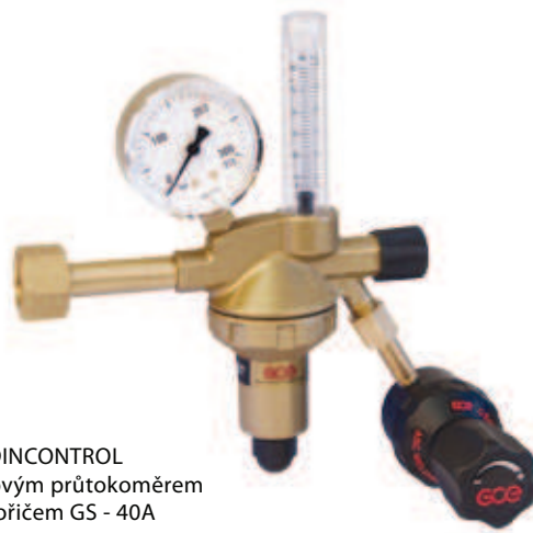
DINCONTROL s plovákovým průtokoměrem a spořičem GS - 40A